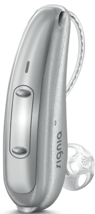
Pure 312 X

Les nouvelles aides auditives Pure™ 312 X, au design plus fin*, offrent de solides performances, pour une audition sur-mesure, tout au long de la journée.